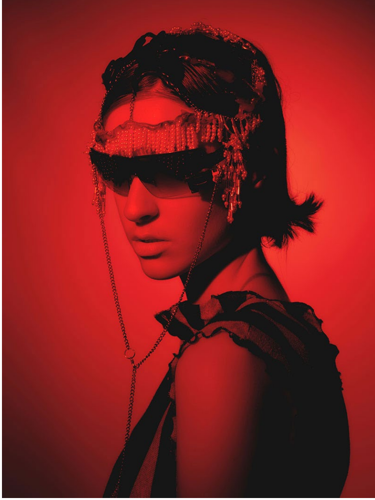
Projecte Final 'This is my head' d'Alba Melgarejo.