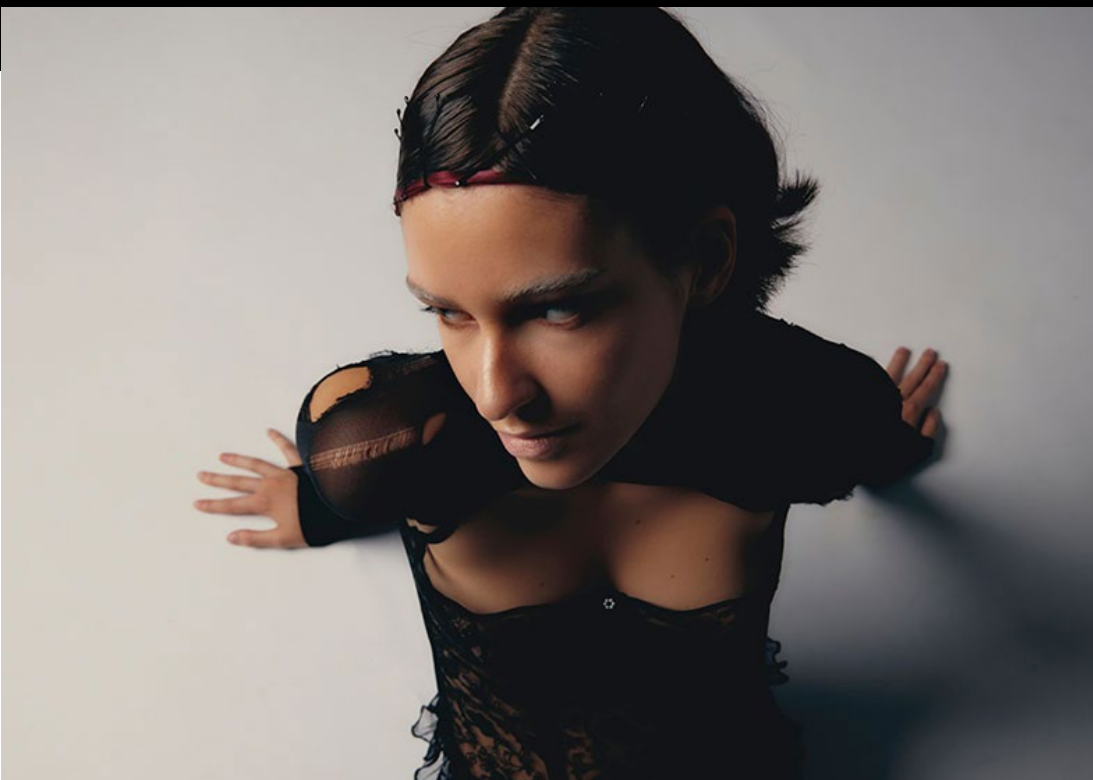
Projecte Final 'This is my head' d'Alba Melgarejo.